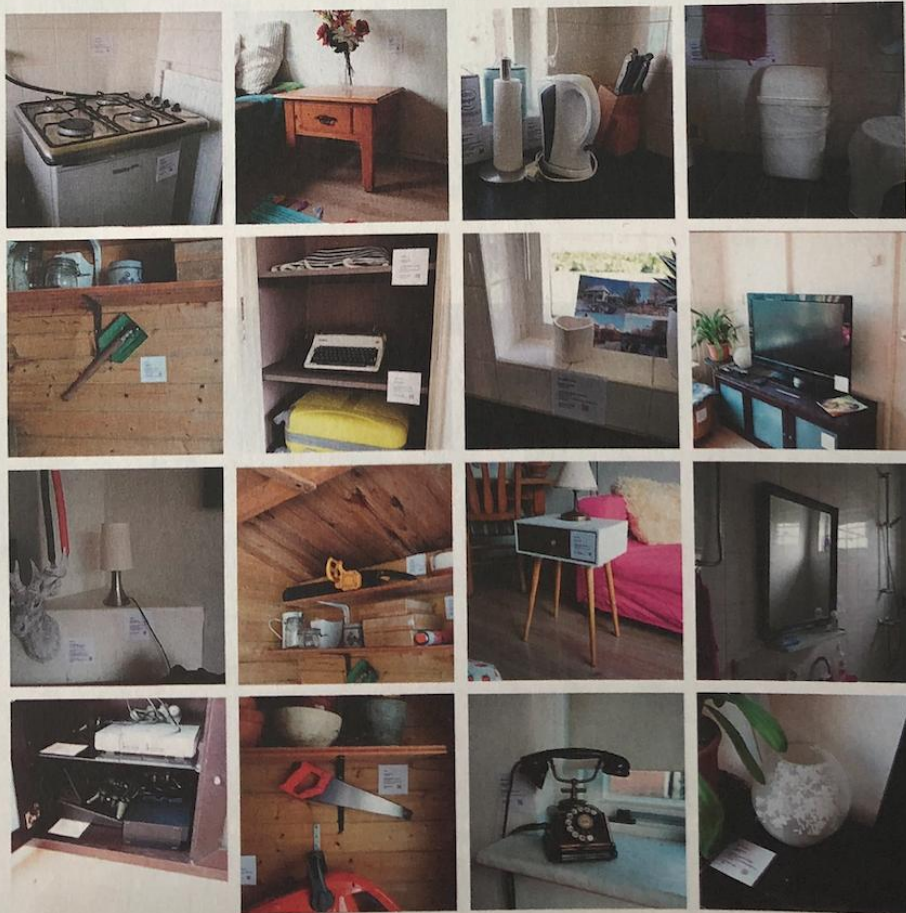
Mijn Huis is Jouw Huis , 2020, installatie, gebruiksvoorwerpen, foto's